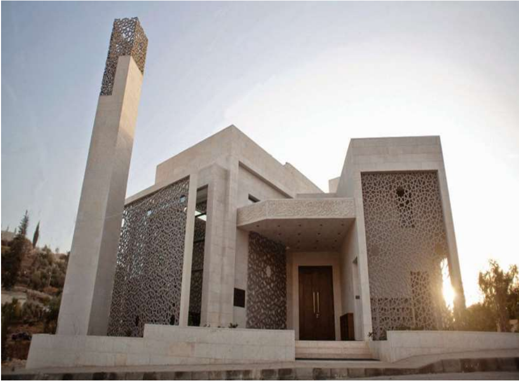
صورة رقم (١٢) مسجد الروضة بعمان في الأردن (٧)