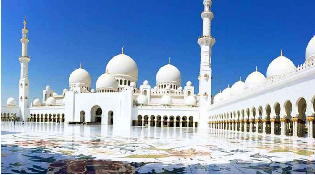
صورة رقم (٧) مسجد الشيخ زايد بن سلطان آل نهيان- أبو ظبي- الإمارات ٢٠٠٦م