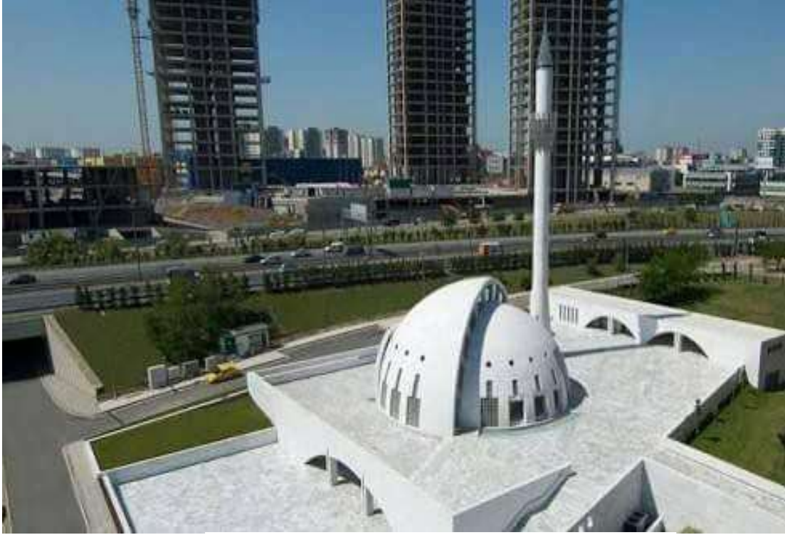
صورة رقم (١٠) مسجد يسلي فادي- اسطنبول- تركيا (١)

صممه المعماري التركي "عدنان كازيماوجلو" على شكل قبتين متعاقبتين، أحدهما أكبر من الأخرى؛ حيث تحتضن القبة الكبيرة القبة الصغيرة، وبينهما فراغ يمثل مصدرًا غير مباشر للضوء، كما يدخل الهواء من الفتحات السفلية للقبتين، ومئذنة مرتفعة. (٣)