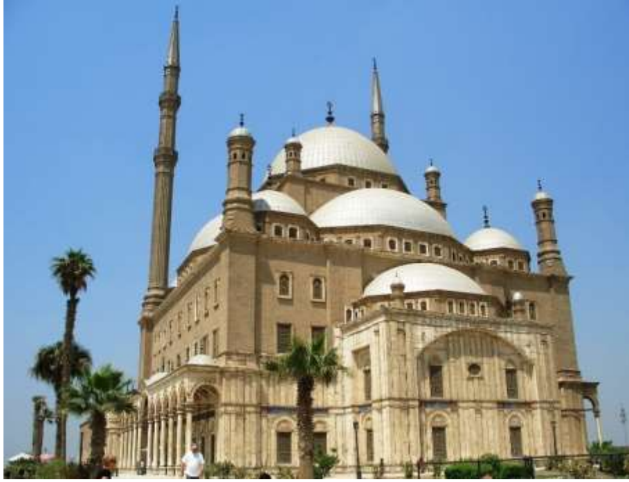
صورة رقم (٤) قلعة صلاح الدين الأيوبي- قلعة الجبل - القاهرة ١٨٨٣م