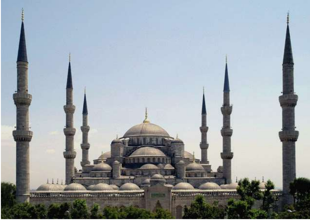
صورة رقم (٦) مسجد محمد الفاتح- المهندس عتيق سنان- إسطنبول- تركيا ١٤٧٠م (أعيد بناؤه في ١٧٧١ بعد وقوع زلزال)

العمارة في بداية القرن التاسع عشر امتداداً للقرن الثامن عشر ليس فيها جديد فهي اقتباس للعمارة القديمة حيث سميت العمارة في ذلك الوقت بالعمارة الكلاسيكية، ومع ظهور الثورة الصناعية وامتداد أثرها على جميع المجالات، بدأ المعماريون الاستفادة من التكنولوجيا والمواد المتاحة للحصول على عمارة متحررة من الماضي ومتقدمة عنه، وبداية من هنا ظهرت العمارة الحديثة كنتيجة طبيعية لهذا التطور، حيث اتجه المعماريون إلى البساطة والاستغناء عن الزخارف وإظهار طبيعة المواد، وانفصلت العمارة الحديثة عن ما سبقها من العمارة من حيث طرق الإنشاء والمواد المستخدمة، وكانت سمات العمارة الحديثة تتمثل في اتباع الشكل للوظيفة واعتبار العمارة هيكل وبدن، والتجريد وإلغاء الألوان والبعد عن الزخارف، ثم جاءت بعدها العمارة الحديثة المتأخرة والتي اتبعت نفس الأفكار مع المبالغة فيها مما أدى إلى الملل والرتابة فأصبحت العمارة لا شخصية لها، ومن هنا ظهر اتجاه ما بعد الحداثة كرد فعل لعيوب العمارة الحديثة المتأخرة، حيث اتجهت عمارة ما بعد الحداثة إلى إحياء التراث والرجوع إلى قاموس الطرز المعمارية التاريخية، واعتمدت عمارة ما بعد الحداثة على مواد العمارة الحديثة وطرق إنشائها ولكنها قامت باقتباس عناصر ومفردات العمارة العربية وتحويلها