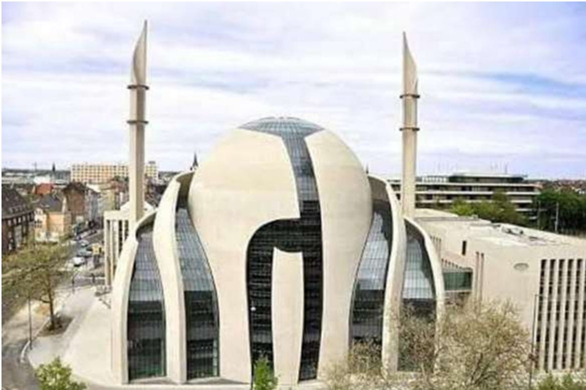
صورة رقم (٨) مسجد كولونيا في ألمانيا ٢٠١٨م

يعد المسجد من التحف المعمارية الرائعة صممه المهندس "Paul Bohm" (١) على شكل برعم متفتح و على الطراز العثماني، مساحته ٤٥٠٠ مترمربع به قبة ومأذنتان بارتفاع