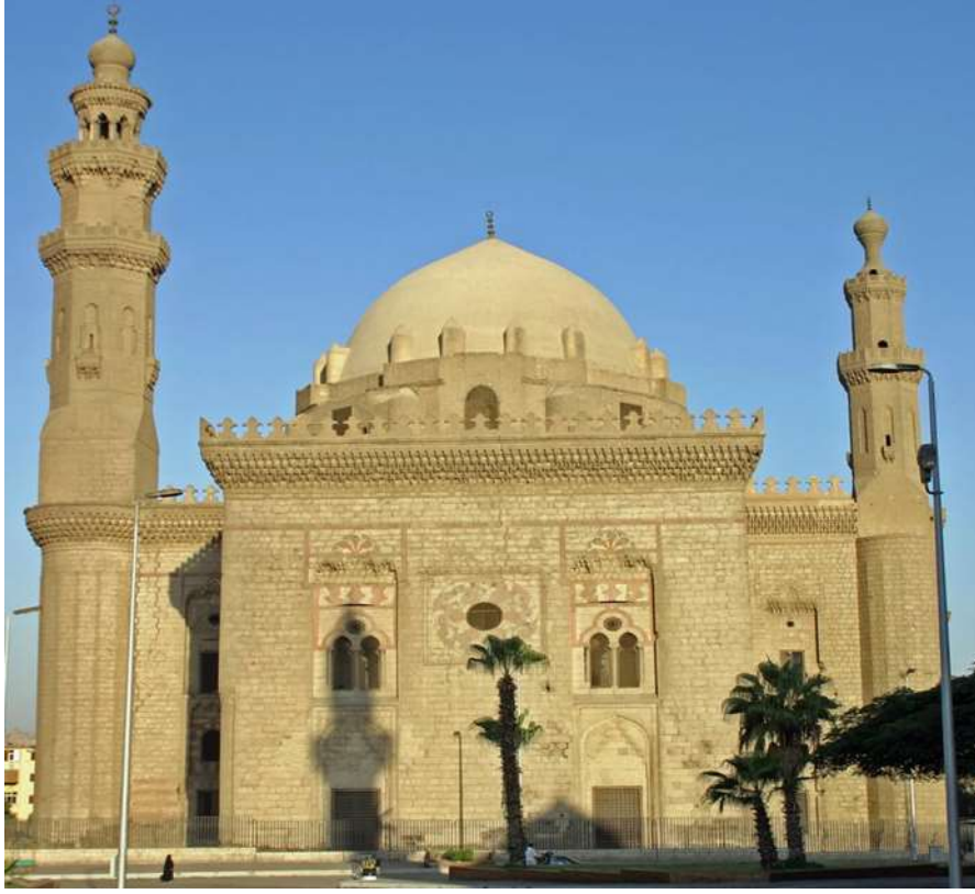
صورة رقم (٥) مسجد السلطان حسن- القاهرة ١٣٦٣م

جديد على شكل قباب متكررة، وقد استعملوا المقرنصات لتغطية نقاط ارتكاز القباب وتحميلها على الأعمدة والجدران، وكانت معظم قاعات الصلاة متوسطة وصغيرة المساحة، وانتشرت التكسية بالقيشاني الملون وبخاصة اللون الأزرق، وكان العقد النصف دائري هو الأكثر انتشاراً، وبعد أن قضى العثمانيون على المماليك فقدت مصر استقلالها وأصبحت ولاية تركية، تأثرت العمارة في مصر بالمساجد التركية في طريقة الإنشاء والتخطيط، ومن أهم المساجد التركية التي بنيت في مصر مسجد الملكة صفية، مسجد أبي الذهب (٨٠، ص ٨٠)