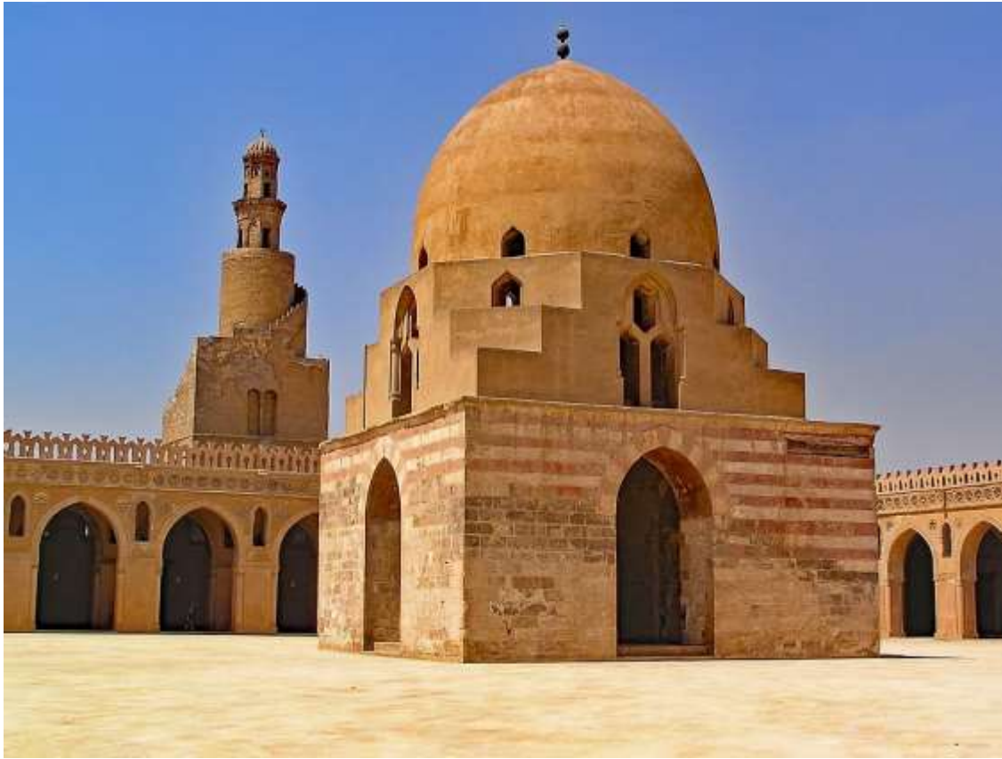
صورة رقم (٢) جامع أحمد بن طولون – القاهرة ٨٧٧م

بعد سقوط الدولة الأموية انتقلت الخلافة للعباسيين حيث نقلوا عاصمتهم إلى بغداد, بنى الخليفة المنصور مدينة بغداد على نهر دجلة على شكل مستدير يتوسطها المسجد والقصر وجعل للمدينة أربعة أبواب, أدى نقل العاصمة إلى بغداد إلى تغييرات جوهرية في أساليب الفن والعمارة, كانت فترة العباسيين فترة ثراء مادي وثقافي ومعماري, اعتمد العباسيون في مبانيهم على المواد المتوفرة في العراق فكانت معظم مبانيهم من الطين والطوب المحروق, وتأثر العباسيين بعمارة بلاد ما بين النهرين والعمارة الفارسية, فقد فضلوا الأكتاف على الأعمدة في حمل العقود والبواكي, واستعملوا الشكل النصف اسطواني في الأبراج المحيطة