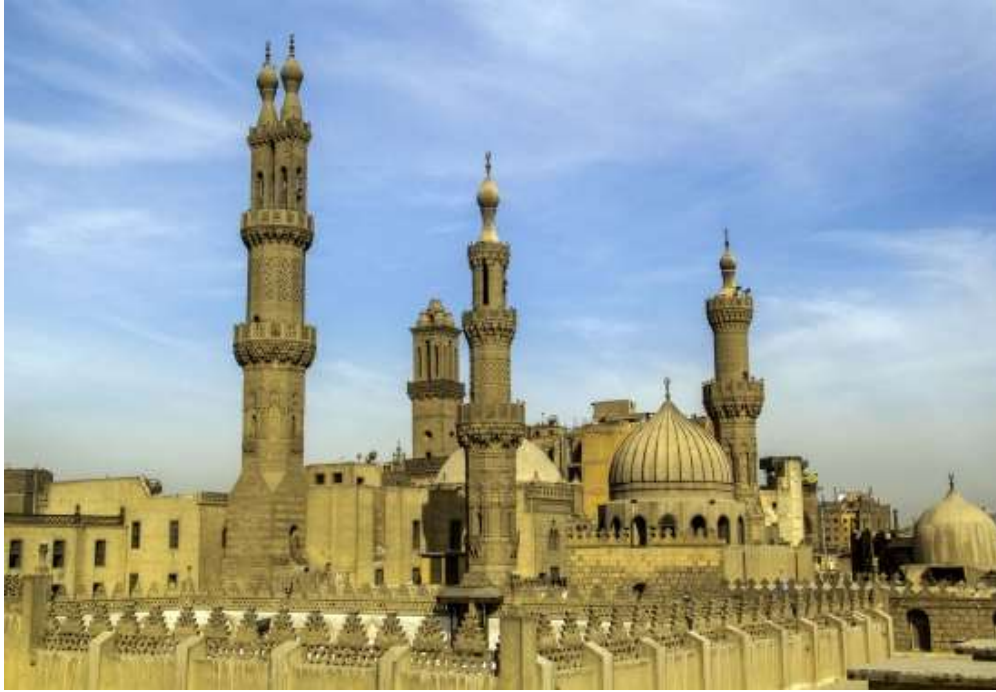
صورة رقم (٣) الجامع الأزهر القاهرة ٩٧٢م

معظم المساجد المسافة التي بين الأعمدة الوسطى في رواق الصلاة والتي أمام المحراب أوسع من البلاطات الأخرى، وظهرت الشرافات المسننة التي تعلو الجدران، كما ظهرت المقرنصات كعنصر انشائي زخرفي، وتتميز المساجد الفاطمية بوجود مداخلها الرئيسية في منتصف الضلع الشمالي المقابل لرواق الصلاة وفي المحور الرئيسي للمحراب، تعددت المحاريب المجوفة في المسجد، واستعملوا الحجر المنحوت في واجهات المساجد لتزيين الواجهات، كما استعملوا الزخارف والكتابة لأغراض