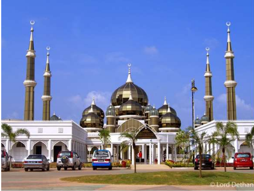
صورة رقم (٩) مسجد الكريستال في ماليزيا ٢٠٠٨م (٢)

مسجد الكريستال في ماليزيا: هو ثاني أكبر مساجد جنوب شرق آسيا بعد جامع الاستقلال في جاركاتا، ويقع المسجد في مدينة كوالا ترغكانو في ماليزيا، وقد أمر ببنائه السلطانُ ميزانُ زين العابدين،