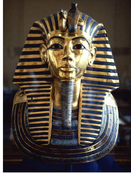
شكل رقم ( ٢ )

قناع الملك توت عنخ أمون - الأسرة الثامنة عشرة و تمثال نفس قناع الملك للفنان فلاديمير تسيفن