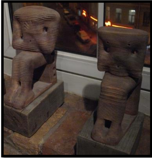
Large Pharaoh Family (2 pieces 4 parts), 1992

استخدامه اللون القاتم في العمل ليؤكد على معان خاصة شكل رقم (٣).