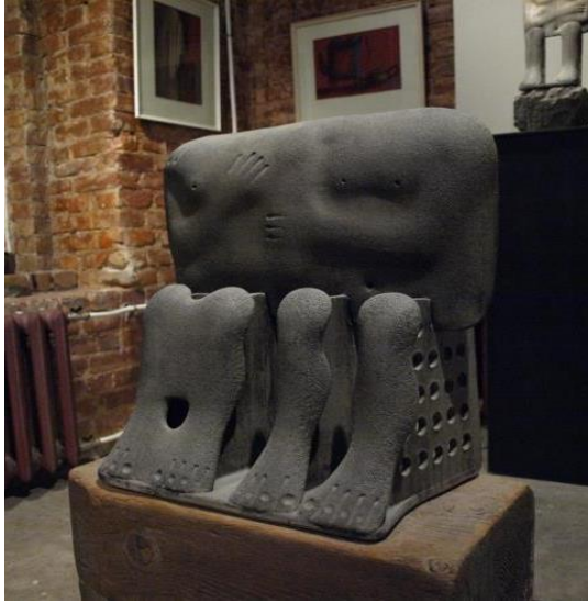
The Family Pair, 1994

النحت في بوتقة واحدة ، التفاصيل محدودة في الشريحة العليا بحيث تعبر كتلة العمل الكلية عن مضمونه وفكرته و يمكن الإشارة للتفاصيل في تشكيل الأطراف بكتل خفية تحت رداء شبه شفاف و إشارة إلى الأصابع عن طريق حزوز ناتئة في كتلة العمل تنتج عنها ظلال توحى بتشكيل الكف ، و في الجزء السفلي تشكل عدد من الشرائح النحتية المصاغة بأسلوب تجريدي عضوي الأطراف السفلية للقرم سنب و زوجته و قد تغاضى الفنان فلاديمير عن تشكيل أبنائهما كما في الأصل المصري القديم ، و مع البعد التام عن التفاصيل و عن استخدام الحزوز الخطية التي تميز أعمال الفنان فلاديمير تي سيفن تبدو عدد من الفتحات الموزعة على أماكن محددة في التشكيل النحتي ، و أخيراً تأكيده على عرافة و عمق التاريخ في استخدام اللون القاتم في العمل شكل رقم (٥)