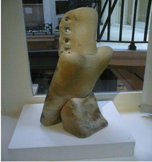
Standing Bird, (2 pieces) -