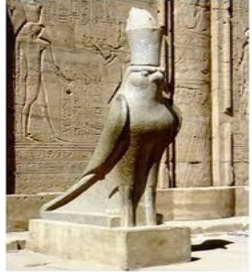
تمثال المعبود حورس