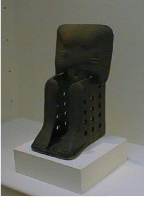
Empty Pharaoh, 1994

ربما حاجة تقنية ، و أخيراً تأكيده على عراقة و عمق التاريخ في استخدام اللون القاتم في العمل.شكل رقم (٦)