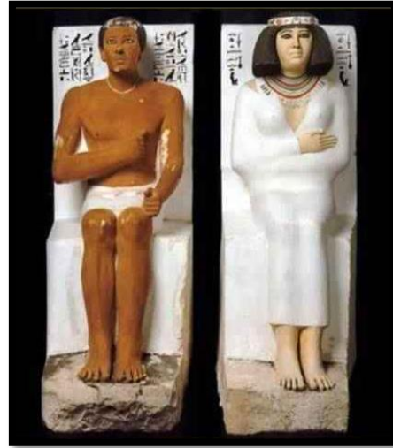
تمثالاً رع حتب و زوجته نفرت- الأسرة الرابعة - الدولة القديمة ٢٥٥٩ : ٢٥٣٥ ق م