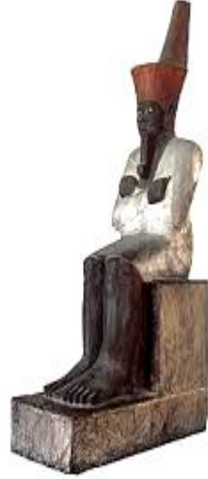
تمثال الملك منتوحتب الثاني - الأسرة الحادية عشرة - مؤسس الدولة الوسطى ٢٠٤٦ : ١٩٩٥ ق.م