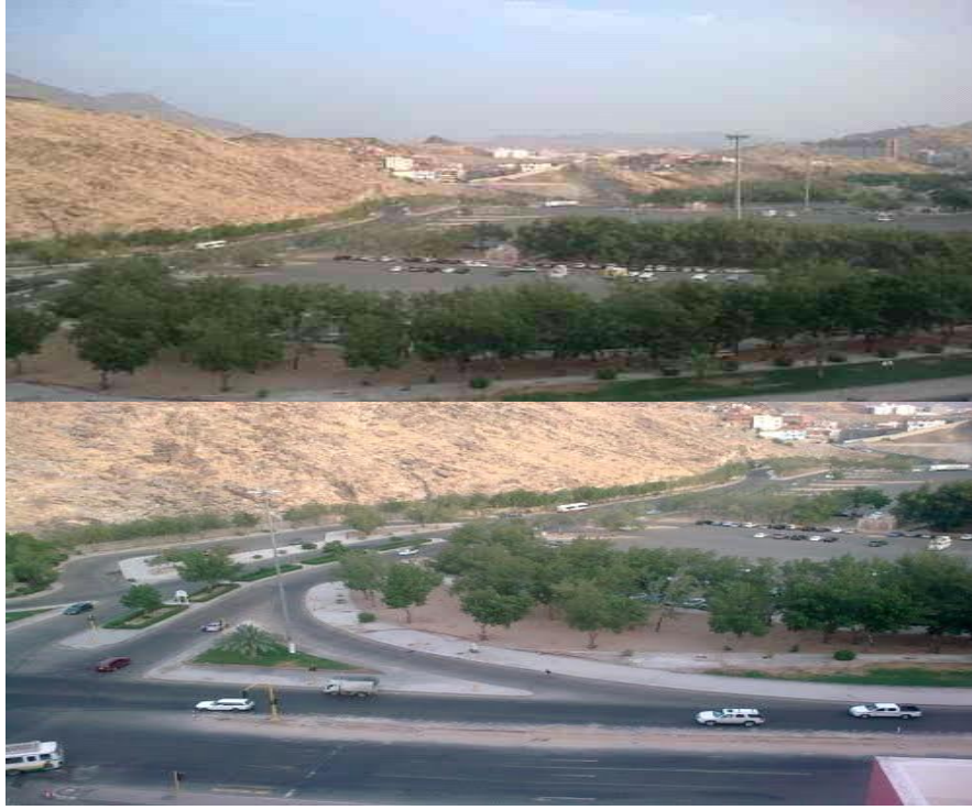
شكل (٤) ساحة كدى "لانتظار الحافلات والطرق الموصلة اليها