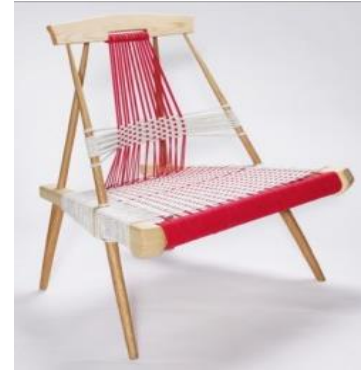
شكل رقم (٩) لمجموعة من تصميمات الكراسي بالمعرض (٢٩)