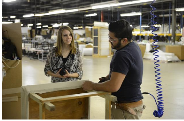
شكل رقم (٧) يوضح تصوير الافراد الذين يقوموا بانتاج الاثاث داخل وحول منطقة الهاي بوينت.(٢٧)