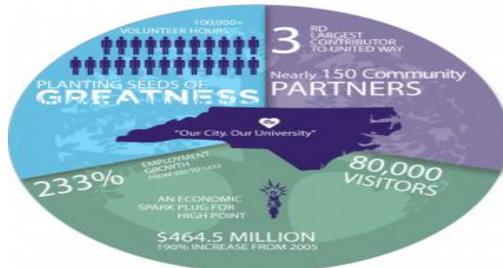
شكل رقم (١٠) يوضح الاثر الاجتماعي لجامعة الهاي بوينت (٣١)

➤ زيادة عدد المباني في الحرم الجامعي لجامعة الهاي بوينت من ٢٢-١١٢ وهو ما يمثل زيادة ٤٠٩ في المئة ،