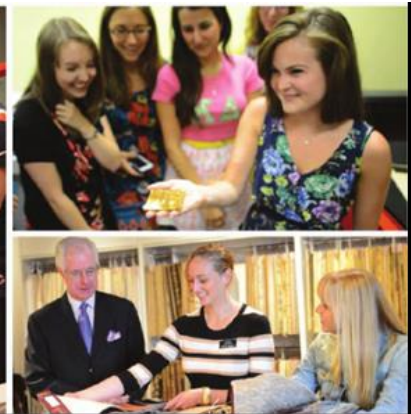
شكل رقم (٣) للطلاب اثناء عملهم بالمختبرات بمدرسة الفن والتصميم (١٦)