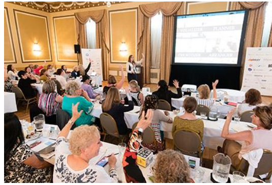
شكل رقم (٦) من مؤتمر Withit بتاريخ يونيو ٢٠١٦ . (٢٢)

وقد حضرته طابقتان من جامعة الهاي بوينت والذي استمر ثلاثة ايام ، وقد زود الطلاب بالفرصة لتعلم الكثير