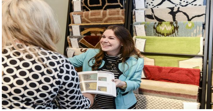
شكل رقم (٥) لطالبة بجامعة الهاي بوينت اثناء عملها في قسم تصميم الاثاث بالمعرض (٢٠) http://www.highpoint.edu/blog/١٠/٢٠١٥/students-receive-experiential-learning-at-high-point-furniture-market/

٧- المؤتمر يساعد المشاركين على توضيح السياسات المختلفة في المواقف و المعطيات. ٨- المؤتمر يفتح المجال للمناقشة الجماعية بين الأفراد و يوفر الفرصة للعمل بروح الفريق . ٩- المؤتمر يعمل على تقوية القدرة الاتصالية داخل الثقافة الواحدة ( المؤتمرات المحلية ) و بين الثقافات المختلفة ( المؤتمرات الإقليمية و الدولية ) حيث تمكن الأفراد المشاركين من التفكير بأسلوب انتقادي و تشجع على حل المشكلات بطريقة منهجية. (٣) ١٠- المؤتمرات تتيح الفرصة للتحديث طبقاً لأحدث الأساليب التكنولوجية . وتهتم جامعة الهاي بوينت بالمؤتمرات العلمية وذلك لما لها من دور عظيم في تنمية البيئة الصناعية وخدمة المجتمع،ومن اشهر هذه المؤتمرات :