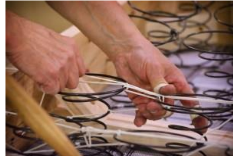
شكل رقم (٨) لبعض الصور من مصانع الاثاث تم عرضها في متحف هاي بوينت لمعرض "Hands behind the Craft" (٢٨)