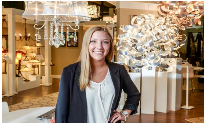
شكل رقم (٤) لطلبة بجامعة الهاء بوينت اثناء عملها فى السوق العالمى لاثاث الهاء بوينت (١٩)

يقوم العديد من طلاب جامعة الهاء بوينت بالعمل في سوق الهاء بوينت وهو اكبر معرض لصناعة وتجارة المفروشات المنزلية في العالم والذي يقام مرتين في العام في مجالى التصميم الداخلى والمفروشات المنزلية بحيث يكتسبوا خبرة مهنية ويتعرفوا على احدث الالوان والاتجاهات في صناعة الاثاث، حيث ياتي الى السوق كبار المصممين ورواد الاعمال والخبراء من جميع انحاء العالم للمشاركة ، مما يتيح لهم فرص العمل فى افضل الاماكن والشركات الشهيرة فى مدينة الهاء بوينت بعد التخرج لما اكتسبوه من خبرة وتجربة العالم الحقيقي والاتصالات على المدى الطويل. (١٨)