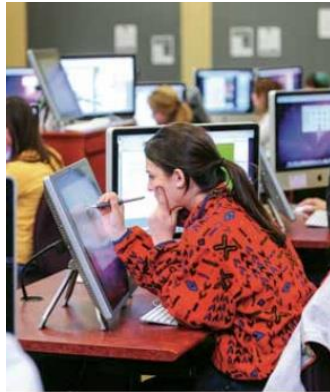
شكل رقم (٢) لحدى الطالبات بمختبرات التصميم بمساعدة الحاسوب (١٥) ص (٨١) highpoint/Undergrad-Bulletin-٢٠١٥-٢٠١٤.pdf

يمكن للطلاب الذين يدرسون في مدرسة الفن والتصميم الحصول على أحدث المعدات التقنية بما في ذلك مختبر تكنولوجي مجهز به ماكينات للقطع بالليزر cnc router ، واجهزة كمبيوتر حديثة ( معمل بة اكثر من ٢٠ جهاز كمبيوتر ماركة (MAC) بشاشة كبيرة ) وباستخدام القلم التفاعلي والذي يساعد الطلاب على استخدام احدث البرامج التصميمية ، و الطابعات ثلاثية الابعاد التي تعطي الطلاب القدرة على إنتاج نماذج مصغرة من الأثاث بمقياس رسم مناسب حسب مخيلتهم التصميمية ، ومن الممكن ان تذهب تصميمات الطلاب الى ابعاد من ذلك فهناك بعض المصانع التي تقوم بعمل مسابقات لتصميم الاثاث بين الطلاب مثل مصنع شيرماج (SHERMAG) الذي اختار طلاب جامعة الهاي بوينت خصيصا لذلك لانها مرتبطة بسوق الاثاث.