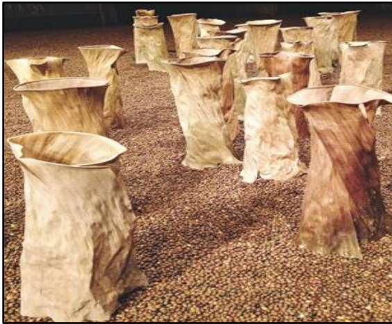
شكل رقم ٤

التحليل الفني للعمل: قامت وحدة العمل على الإرتكاز على العناصر الهندسية والتوليف بينها و خلق تناغم بين عناصر العمل من خلال اللون والإيقاع اللوني، والتأكيد على تعظيم القيم السطحية في العمل والمؤكد على ترابطه وخلق وحدة للعمل وأكد ذلك الخلفية حيث أعطت متزاج كبير بين العناصر .