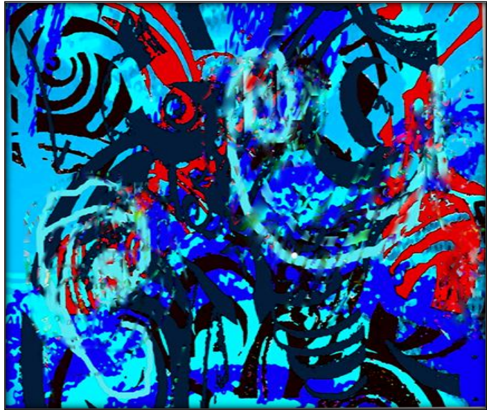
تصميم (رقم ٤)

-مقاس العمل: ٢٩.٧×٢١ سم -الألوان المستخدمة:الأزرق الفاتح -الأحمر- الأزرق الغامق-الأسود - الغرض الوظيفي :ملاءات أسرة -أقمشة تتجيد