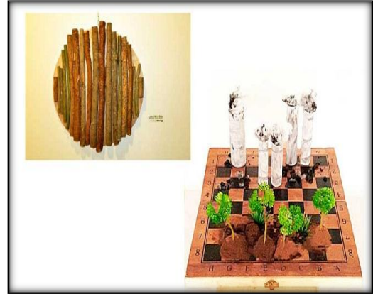
شكل رقم ١

اسم الفنان: آسيا خلاب اسم العمل: حلم ممكن سنة العمل: ٢٠١٦ مكان العرض: معرض (الفن في خدمة الكوكب) بالمغرب