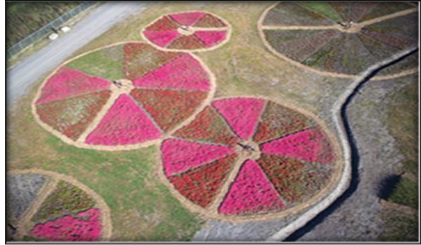
شكل رقم ٢

اسم الفنان: جان بيل غانم اسم العمل : تركيبات زراعية سنة العمل: ٢٠٠٠-٢٠٠٢ المكان: كندا