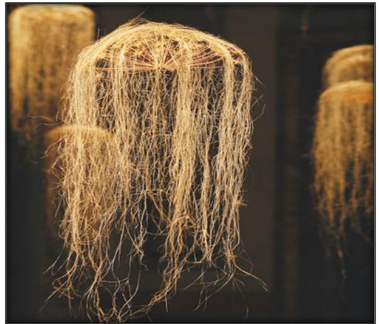
شكل رقم ٣