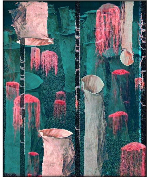
تصميم رقم ٣

-مقاس العمل: ٢٩.٧×٢١ سم -ألوان العمل: البيج-البمبي الفاتح-البمبي الغامق-التركواز الغامق -الغرض الوظيفي: أقمشة تنجيد