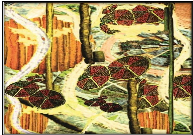
تصميم (رقم ١)

-مقاس العمل: ٢٩.٧×٢١ سم -الألوان المستعملة:الأخضر الغامق -الأخضر الفاتح- الأحمر الغامق-البرتقالي الغامق-الابيض - الغرض الوظيفي: يصلح لأقمشة التنجيد