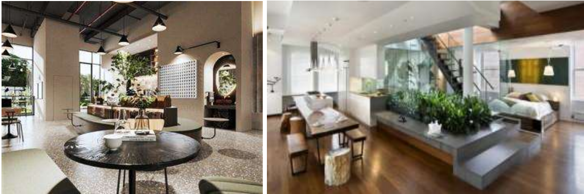
الصور ( ٣٩ - ٤٠ ) توضح نماذج لاستخدام معتدل للشفافية غير مغل بالخصوصية المطلوبة ويرتبط بوضوح بالطبيعة بما يحقق شعورا بالألفة والسكون والبهجة مكونا عاطفة إيجابية للأفراد داخل المسكن.(١٩)

الجانب النفسي والوجداني لاستخدام مفهوم الشفافية : إن وجدان الأفراد يتشكل نتيجة تفاعلهم مع البيئة المحيطة بهم. لذا يجب الاهتمام بالناحية الوجدانية أو الانفعالية للأفراد باعتبارها وسيلة الفرد للتكيف في ضوء التحديات العصرية الحديثة ، فالتصميم الداخلي لبيئة الفراغات الداخلية هو المنظم لمكونات الفراغ وكل ما يتعامل معه الفرد مما يجعله يؤثر في تشكيل وجدان إيجابي لدى الأفراد بتصميم بيئات داخلية تحتوي على مثيرات ومحفزات إيجابية فيما يسمى بالتصميم الوجداني.