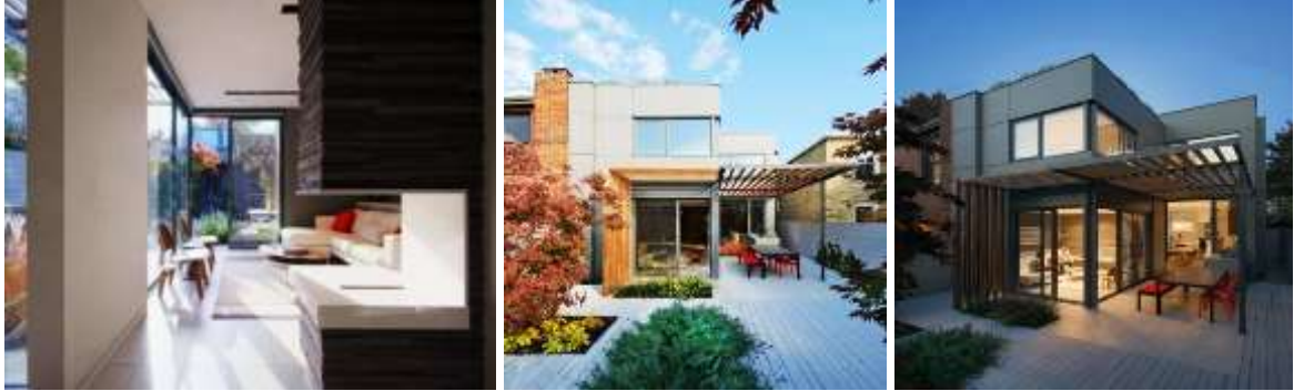
الصور (٦-٨) توضح أسلوب الاطلال الخارجي والامتداد بالحديقة مع شفافية الواجهات وتواصل منطقة المعيشة مع الطبيعة (١٤)

أن الجدران الزجاجية في المنزل ليست فقط قرار جريء ، ولكن أيضاً فرصة لجعل المساكن صغيرة الحجم بصرياً أكثر اتساعاً ومشرفة، من خلال خلق بيئة معيشة