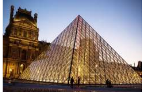
الصورة (١٦) توضح استخدام الزجاج المقوى المعدل في انشاء هرم اللوفر (١٢)

يتألف المبنى من ١٣ طابقاً، ويعد من أجمل المباني في إسبانيا، ويبدو أقرب إلى متحف أو معرض للفن منه إلى مبنى حكومي، وهو المقر الرسمي لوزارة الصحة الإسبانية، ويقع في مدينة "بيلباو" - عاصمة إقليم "الباسك"، ويسمح البناء الزجاجي بدخول الضوء الطبيعي إلى داخل المبنى فيبدو منيراً وبراقاً، كما يعكس أفق المدينة فيضفي مظهراً جذاباً على المبنى من الخارج، ويعد من أحد المزارات السياحية الشهيرة في إسبانيا.