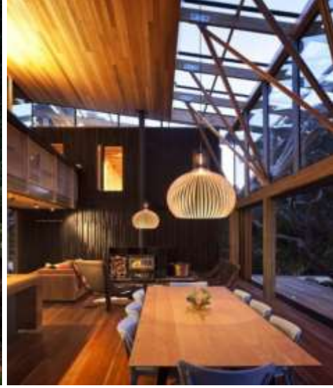
الصور ( ٢٥ - ٢٦ ) توضح استخدام مفهوم الشفافية في التصميم الداخلي من خلال البيوت الزجاجية - (٢٢)