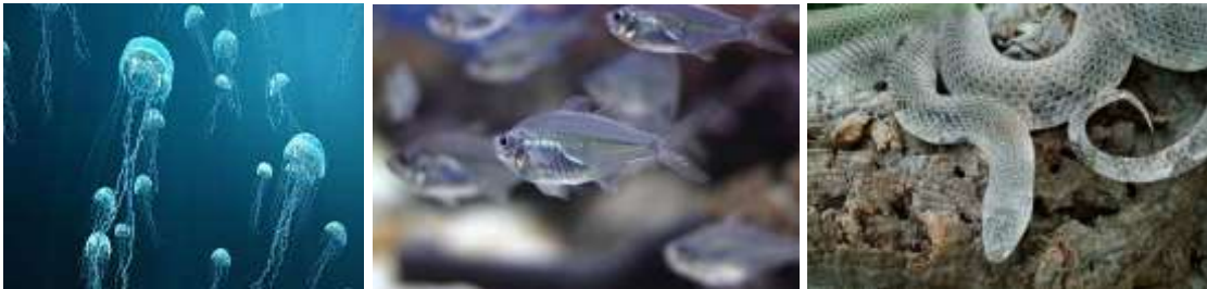
الصور (١-٣) بعض الكائنات الحية التي تتميز بالشفافية سواء المؤقتة او الدائمة (٢٣)

بأنواعها التي تحقق الشفافية الجزئية ،وذلك من خلال مفهوم انتقال الضوء عبر المواد ذات الشفافية والذي يلعب الدور الأبرز في رسم حدود التصميم المعماري، سواء الخارجي والداخلي ، فالشفافية في التصميم المعماري هي نتاج التطور التقني في القرن العشرين، والذي استطاع