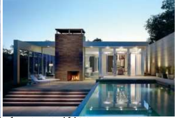
الصورة (١٤ - ١٥) الشفافية في البيوت الزجاجية وتأثيرها على شكل الفراغ الداخلي