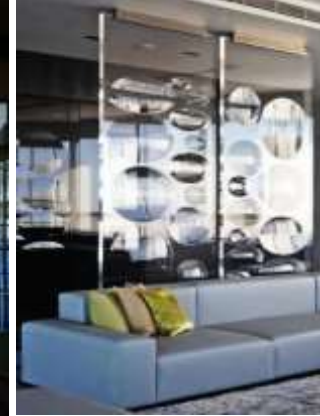
الصور ( ٢٧ - ٢٩ ) توضح تدرج مستويات الشفافية من خلال القواطع مصادر الصور (١٩-١٩-24)