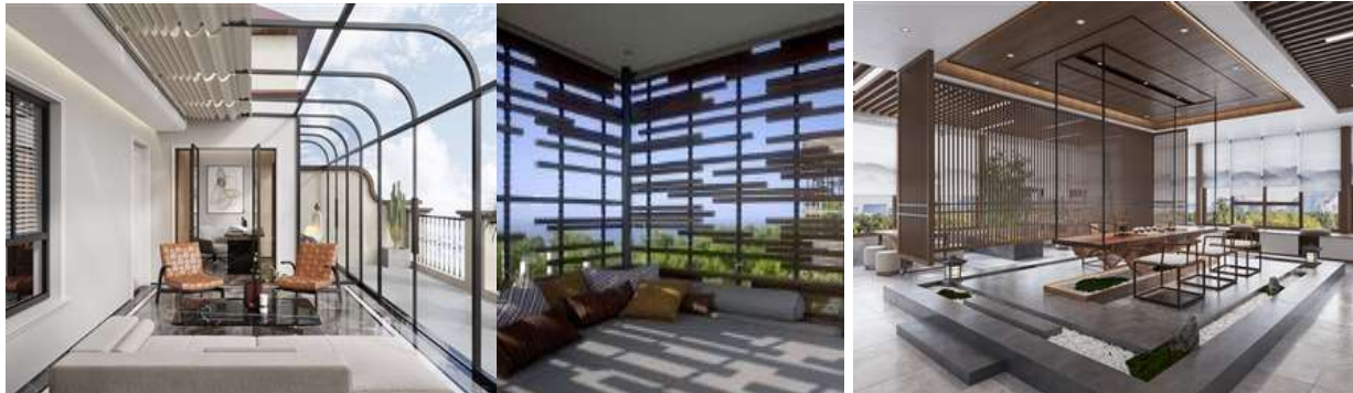
الصور (٤٦ - ٤٨) توضح اختلاف التأثير الناتج عن نفاذية الضوء باختلاف الخامة المنفذ بها التصميم فكلما زادت تفاصيل ملمس السطح، فإن الضوء الساقط يخلق عليه تباينات وظلال أكثر (١٩)