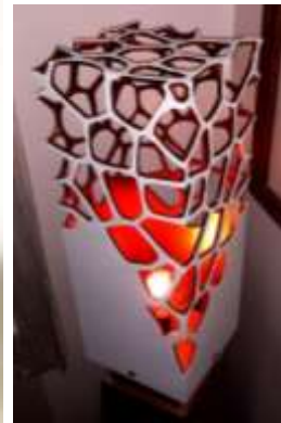
الصور (٥٢ - ٥٤) توضح تدرج مستويات استخدام مفهوم الشفافية في التصميم الداخلي من خلال الاثاث- مصدر الصور بالترتيب (١٧- 18- ١٩)

البصري و التصميمات التفاعلية وغيرها من الاتجاهات الحديثة سواء في العمارة أو التصميم الداخلي والاثاث ،كما أنها تر تبط ارتباط وثيق بعلم النفس المعماري بدليل انسجام الياتها مع استحضار محفزات متعددة تخاطب الوجدان من ملامس وألوان وإضاءة طبيعية ، هذه المشاعر تكون عاطفة إيجابية لدى الأفراد.