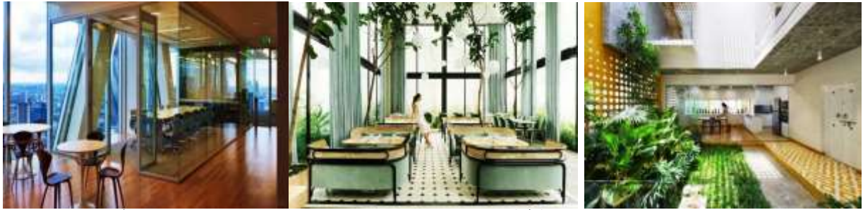
الصور (٢٢ - ٢٤) توضح تنوع طرق الشفافية في التصميم الداخلي للاستفادة المثلي من التواصل مع الطبيعة (١٩-10-10)

النوافذ في البيت الزجاجي تسمح للمستخدم أن يكون أقرب إلى الطبيعة. ومن أجل أن تشعر بالراحة، فإنها تتضمن مصاريع أوتوماتيكية أو يدوية، والتي تحمي ضد الكثير من الضوء تهاراً أو الظلام ليلاً. أيضاً يمكن دهان الزجاج بطبقة خاصة من الطلاء لتكون واقية من الشمس مثل اليه النظارات الشمسية .