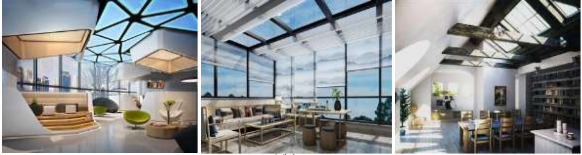
الصور (٤٩- ٥١) توضح استخدام مفهوم الشفافية في التصميم الداخلي من خلال الحوائط والاسقف (١٩)

يمكن تطبيق الشفافية من خلال احدى عناصر ومكونات التصميم الداخلي سواء الحوائط او الاسقف أو الارضيات أو حتى من خلال العناصر الانشائية داخليا كالسلالم والفواصل ويمكن ان يكون من خلال الاكسسوارات والمكملات والاثاث كما أنه من الممكن أن يكون هناك أكثر من مكون معا يتسم بالشفافية بل ويمكن ان يكون