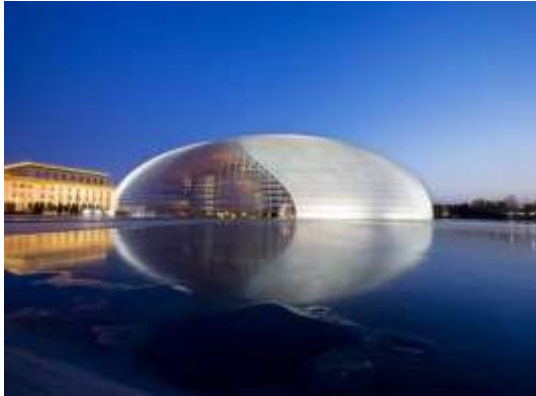
الصورة (١٨) الشفافية بمبنى متعدد الأغراض بيكين (٩)

يتألف المبنى من ١٣ طابقاً، ويعد من أجمل المباني في إسبانيا، ويبدو أقرب إلى متحف أو معرض للفن منه إلى مبنى حكومي، وهو المقر الرسمي لوزارة الصحة الإسبانية، ويقع في مدينة "بيلباو" - عاصمة إقليم "الباسك"، ويسمح البناء الزجاجي بدخول الضوء الطبيعي إلى داخل المبنى فيبدو منيراً وبراقاً، كما يعكس أفق المدينة فيضفي مظهراً جذاباً على المبنى من الخارج، ويعد من أحد المزارات السياحية الشهيرة في إسبانيا.