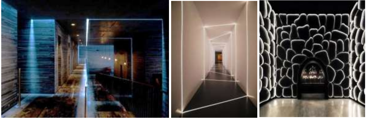
الصور ( ٣٦-٣٨ ) توضح نماذج لاستخدام الإسقاط الضوئي بأنواعه المختلفة لأحداث شفافية جزئية إيهامية - مصدر الصور (١٩-٢٠٠٠)

وتعتبر الشفافية أهم هذه المحفزات حيث يعطى التصميم باستخدام العناصر المعمارية او عناصر التصميم الداخلي ذات الشفافية المتنوعة والمتدرجة شعورا بالألفة والسكون والبهجة والاتصال مع الطبيعة، من خلال محفزات متعددة تخاطب الوجدان من ملامس وألوان وإضاءة طبيعية ، هذه المشاعر تكون عاطفة إيجابية للأفراد داخل المسكن.(٥)