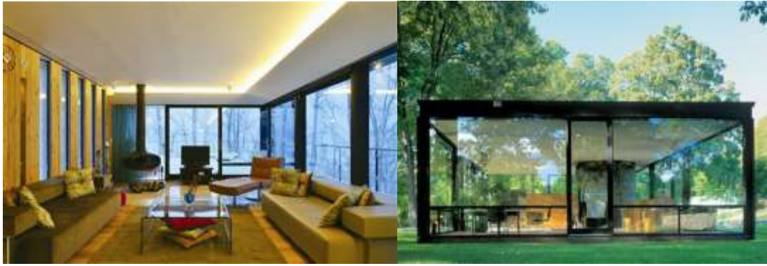
الصور (١٢- ١٣) الشفافية في البيوت الزجاجية وتأثيرها علي شكل الفراغ الداخلي - مصدر الصور (٢٢)

البيوت الزجاجية كأهم تطبيقات الشفافية المعمارية : هذه المباني تلبي متطلبات الراحة ودافئة لمناخنا. ولكن فقط النوافذ فيها صغيرة، وذلك في الغرف وعادة ما تكون مظلمة. ويمكنك التمتع بالطبيعة فقط على الشرفة، وحتى