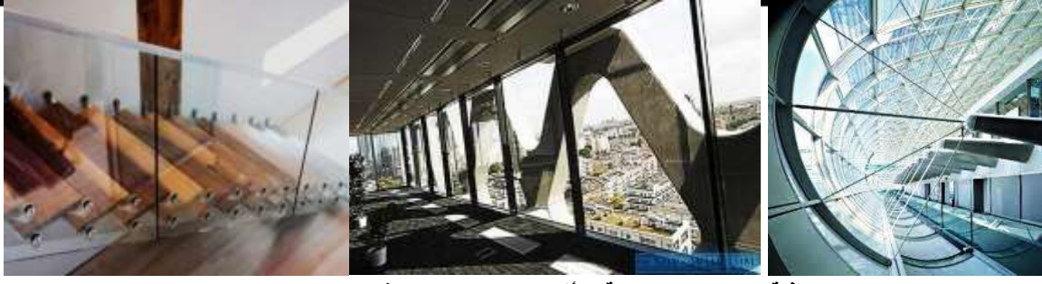
الصور (٩- ١١) الشفافية والعناصر الاتشائية وتأثيرها علي شكل الفراغ الداخلي-مصدر الصور (19- 4-21)

ذلك الحين فقط في فصل الصيف. ولذلك، فإنه ليس من المستغرب أن الآن المصممين والمهندسين المعماريين تقدم لنا تسوية في البيوت الزجاجية.