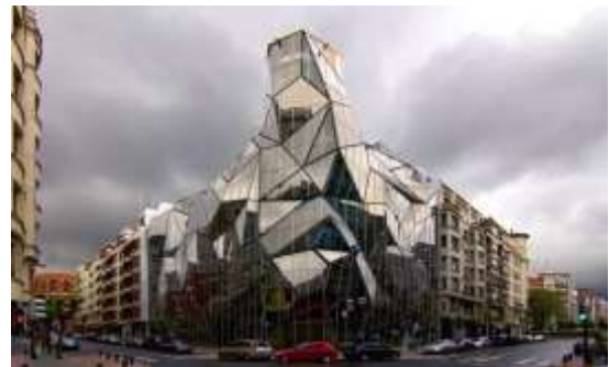
الصورة (١٧) الشفافية في مبنى وزارة الصحة "بيلباو" (٩)