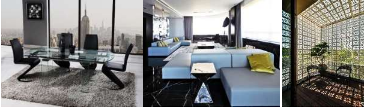
الصور (١٩ - ٢١) توضح تدرج مستويات الشفافية في التصميم الداخلي تبعاً للخامة والتصميم (١٩-٢٤-٢١)

ترتبط الشفافية في التصميم الداخلي بمجموعة من العوامل النفسية والاجتماعية والثقافية للإنسان والمجتمع الذي يعيش فيه ، وذلك من خلال تعدد النشاطات والوظائف التي يقوم بها الإنسان في مختلف الفراغات التي يمكن أن يوجد بها. أما الحدود الزمانية فتتحدد من خلال مجموعة من المتغيرات التي يمكن أن تطل هذه النشاطات