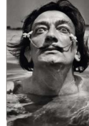
شكل (٣) الفنان الإسباني سلفادور دالي.

https://www.heatherjames.com/ar/artist-intro/?at=SALVADORDALI