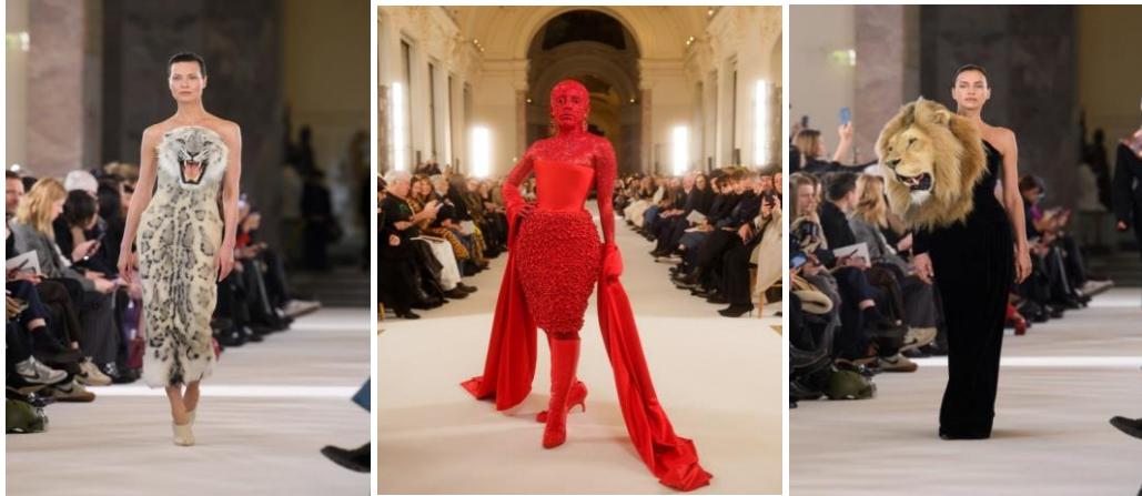
شكل (١٢) مجموعة haute couture من دار Schiaparelli لربيع وصيف ٢٠٢٣م https://www.hiamag.com 30/10/2023, 10:48 pm.

رؤية الباحثة في المجموعات التصميمية السابقة لدار Viktor & Rolf فأتت التصاميم مختلفة تماماً من حيث الشكل والخطوط، وخارجة عن المألوف تعكس بوضوح الفكر السريالي، وقد تكون الأفكار التصميمية الغريبة ناجحة وقادرة على جذب الأنظار، لكنها تصميّات غير مرغوبه.