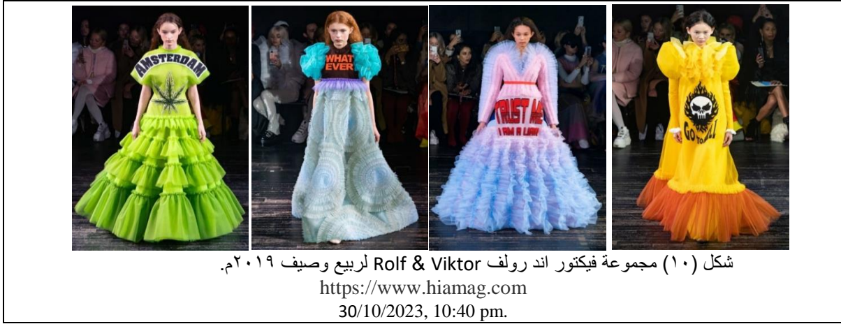
شكل (١٠) مجموعة فيكتور اند رولف Rolf & Viktor لربيع وصيف ٢٠١٩م.

دار فيكتور اند رولف Rolf & Viktor قدمت مجموعة لربيع وصيف ٢٠١٩م شكل (١٠)، هي مختلفة بالتأكيد عن كل عروض الأزياء التي شهدتها أسبوع الموضة الباريسي للأزياء الراقية، فأنت مختلفة تماما من حيث