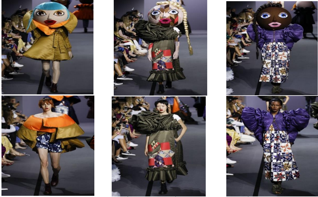
شكل (١٥) عرض أزياء Viktor & Rolf في أسبوع الموضة الأزياء الراقية لخريف وشتاء ٢٠١٧ م . https://www.hiamag.com 30/10/2023, 10:40 pm .

المجموعات التصميمية المقترحة، من خلال مجموعة من المعايير على محورين أساسيين يقوم المتخصصين في مجال الأزياء والموضة بالإجابة عليها عن طريق الاختيار من متعدد (ملانم، ملانم إلى حد ما، غير ملانم):