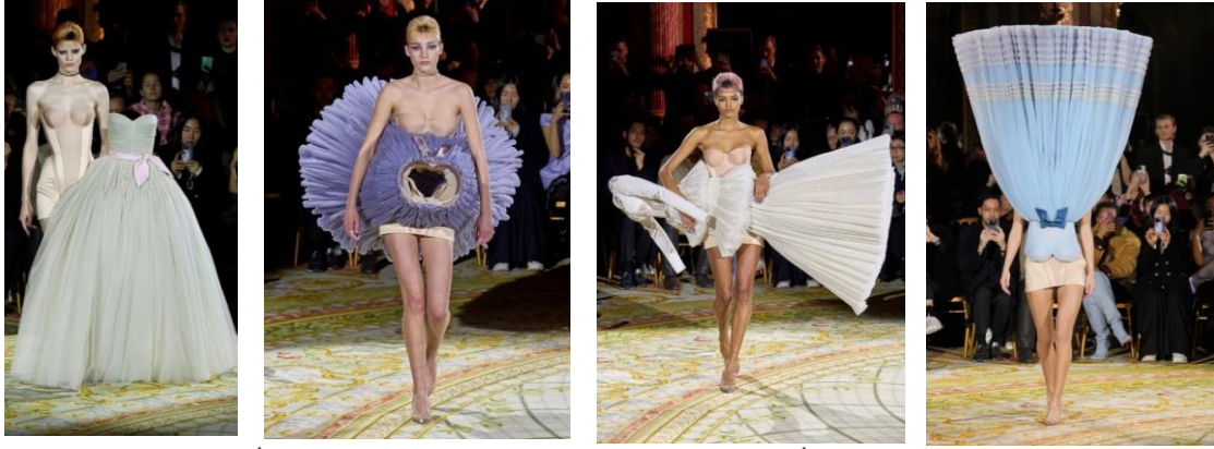
شكل (١١) مجموعة الأزياء الراقية لربيع وصيف ٢٠٢٣ من علامة "فيكتور أند رولف". https://www.trendhunter.com/trends/victor-rolf-spring-2023-couture 2 /11/2023, 9:07pm.

عرض دار سكايريلي Schiaparelli لأسبوع الموضة في باريس للأزياء الراقية لموسم ربيع وصيف ٢٠٢٣م، شكل (١٢)، وقد نجح في لفت الأنظار وتصدّر الترنند منذ اللحظات الأولى لانطلاقته. https://www.hiamag.com