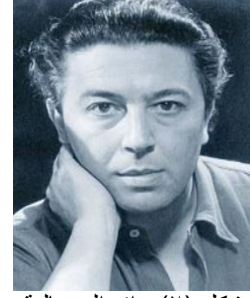
شكل (٢) رائد السريالية "أندريه بريتون"

سلفادور دالي شكل (٣) ولد سنة 1904 م وهو رسام إسباني، ويعد من أبرز رواد السريالية، وقد أضاف إليها إضافات كثيرة أبرزها أسلوبه الذي تميز به "النقد المبني على الهلوسة" وكان يؤكد دائما أنه أقرب إلى الجنون منه إلى الماشي نوماً، والمعرفة عنده تقوم على التداخي والتأمل، يجسد الفنان سلفادور دالي ظاهرة جديدة في السريالية التي تمثلها المرحلة الأولى من إنتاجه الفني، وقد طرح أكثر من سؤال عن القيمة الإبداعية الكبيرة في أعماله التي أغنت المدرسة السريالية من خلال اعتمادها على العديد من ظواهر التحليل النفسي. (Joseph, 2010)