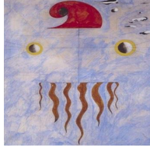
شكل (٧) أعمال الفنان الإسباني خوان ميرو.

25/10/2023, 12:11 am. https://artuk.org/discover/artists/miro-joan-18931983