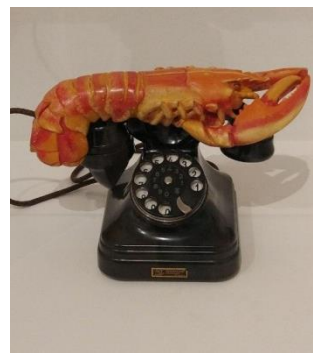
شكل (٨) فستان جراد البحر من عام ١٩٣٧ من تصميم إلسا سكابريلي ومنحوتة سلفادور دالي

https://www.dalipaintings.com/lobster-telephone.jsp 28/10/2023, 1:15 am