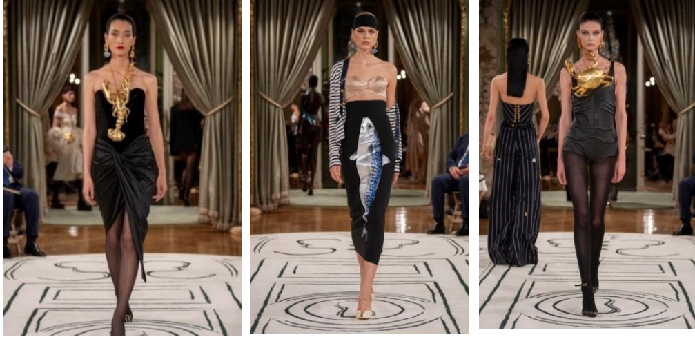
شكل (١٣) مجموعة haute couture من دار Schiaparelli لربيع وصيف ٢٠٢٤. https://www.hiamag.com/30/10/2023,10:50pm .

وتنانير طويلة كلاسيكية متنوعة الطول، وتشكل خياراً مثالياً للحصول على إطلالة جريئة وجذابة في هذا الموسم.