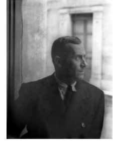
شكل (٦) الفنان الإسباني خوان ميرو.

اكتسب ميرو شهرة عالمية، وفُسرَت أعماله على أنها سريرية، ومعمل تجارب للعقل الباطن، ومحاولة لاستعادة الطفولة شكل (٧)، وأطلق نداءه الشهير "باغتيال التصوير" لتغيير العناصر المرئية في فن التصوير المعتاد، وتفرد عن غيره من فناني السريالية بزوجه نحو التبسيط. https://www.marefa.org