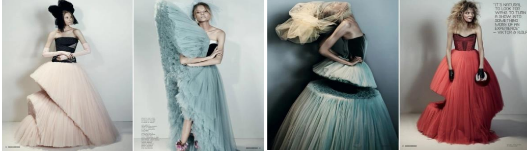
شكل (٩) مجموعة الأزياء الراقية لربيع وصيف ٢٠١٠ من علامة "فيكتور أند رولف".

وكالة الأزياء الهولندية «فيكتور اند رولف» Victor & Rolf قدمت تصميمات لربيع وصيف ٢٠١٠م شكل (٩)، تحمل روح الاستهزاء أو السخرية من الأزمة الاقتصادية وبذلك قررا (التقلص والقطع) أو بمعنى آخر "الخصم" أيضا من فساتين التل الي صمموه.