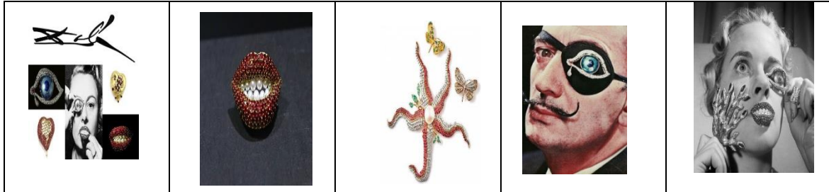
شكل (٥) مجوهرات من عمل الفنان سلفادور دالي.

وكان دالي قد وقّع عقداً مع شركة تصنيع المجوهرات "Alemany & Company" عام ١٩٤٩م شكل (٥)، لإحياء تصميماته الفنية السريالية. شفاه ياقوت ١٩٤٩م