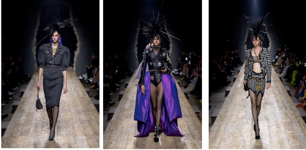
شكل (١٤) مجموعة موسكينو Moschino لموسم خريف شتاء ٢٠٢٣م. https://kulalusra.ae/ar/fashion-and-beauty/fashion/2023/02/26/6318066 5 /11/2023, 10:20pm.

أطلقت علامة موسكينو Moschino مجموعة لموسم خريف ٢٠٢٣م شكل (١٤)، بهدف إضافة لمسة جديدة لرؤية الدار الجمالية. وتتنوع قطع التشكيلة بين التصاميم الواسعة بمسامير مدببة وملينة بالمجوهرات