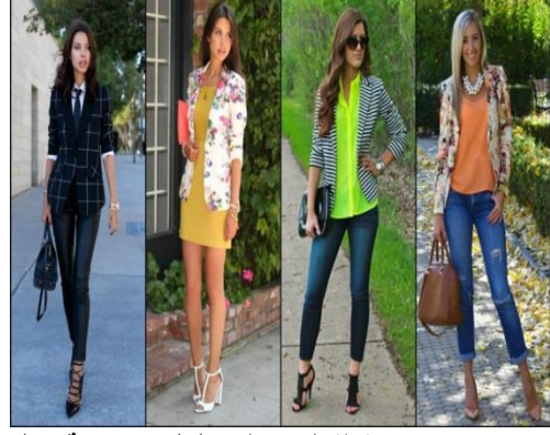
صورة (١) استخدام خامات نسيجية معاد استخدامها www.alga.mal.net