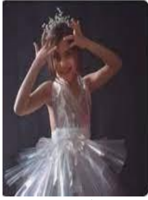
صورة (٢) استخدام خامات نسيجية معاد استخدامها www.her.news.com