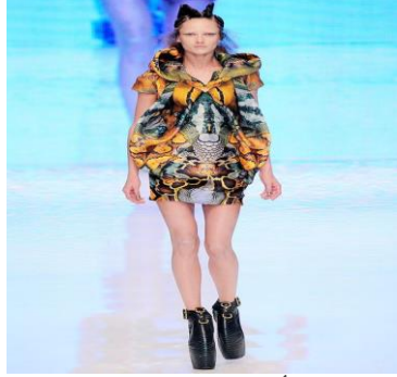
صورة (٦) ألكسندر ماكوين - لربيع وصيف ٢٠١٠