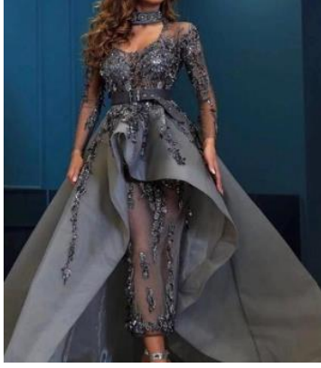
صورة (٤) ملابس بعد الظهر https://www.pixiemarket.com

ملابس بعد الظهر: الحفلات البسيطة، الزيارات العائلية. تشمل التايور بتصميم خاص ويُوصف بأنه قماش فاخر نوعاً ما وناعم. صورة (٤).