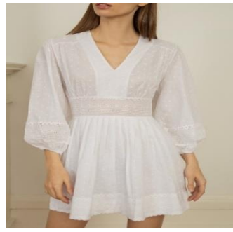
صورة (٥) ملابس السهرة https://www.pinterest.com

وعدد الطلاب ٤٧ طالب يقوم كل طالب بتصميم وتنفيذ فستان أو جاكيت أو بانطلون أو سلوبيت وتم اختيار عشر تصميمات فقط لهذا البحث حيث تمثل التقنيات المختلفة والمتنوعة للملابس المعاد استخدامها وتم اختيار التصميمات من قبل الباحثين نظراً لتميزها بإعادة استخدامها مرة أخرى.